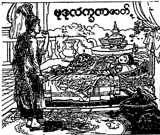
ပစ္စယန်ဝတ္ထု

မြတ်စွာဘုရားသည် ဇေတဝန်ကျောင်း၌ သီတင်းသုံးစဉ် .... သာဝတ္ထိမြို့၌နေသော အမျိုးသားသည် ရဟန်းပြုပြီး ကမ္မဋ္ဌာန်း တရားကို အမြဲနုလုံးသွင်း၍ နေလေ့ရှိ၏။ တစ်နေ့တွင် ဆွမ်းခံသွားရင်း မိန်းမလှကလေး တစ်ယောက်ကို တွေ့မြင်ရသောအခါ ကမ္မဋ္ဌာန်းတရား များ ပျောက်၍ ကိလေသာဖြင့် စိတ်အနှောင့်အယှက်ဖြစ်ကာ ကိုယ် ရောစိတ်ပါ မချမ်းသာနိုင်ဘဲ ကမ္မဋ္ဌာန်းတရားကို အားမထုတ်နိုင်၊ သာသနာတော်မှာ မပျော်ပိုက်၊ ဆံ၊ မုတ်ဆိတ်ကိုလည်း မရိတ်၊ ခြေသည်း လက်သည်းကိုလည်း မလှီးနိုင်၊ သင်္ကန်းကိုပင် မလျှော် နိုင်၊ ငေးငေးမြိုင်မြိုင် ရှိနေသည်ကို တွေ့မြင်ရလျှင် မိတ်ဆွေ ရဟန်း